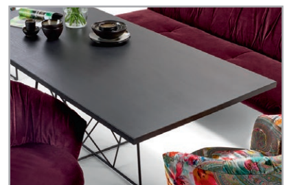
Dazu passende massivholz Esstische