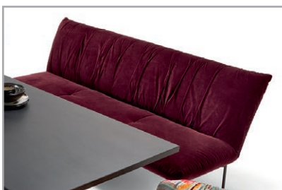
Sitzbank mit edler Plissierung, ohne Armteil