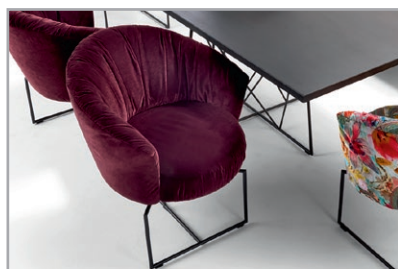
Komfortabler Sessel mit Plissierung und 360° Drehfunktion