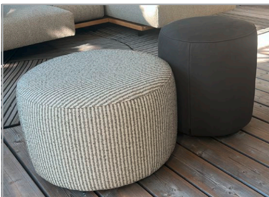
Erhältlich in 2 Größen