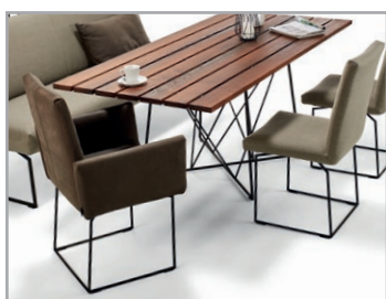
Legerer Stuhl mit Funktionsrücken, wahlweise mit oder ohne Armteil erhältlich