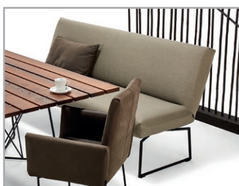
Komfortable Bank ohne Armteil erhältlich