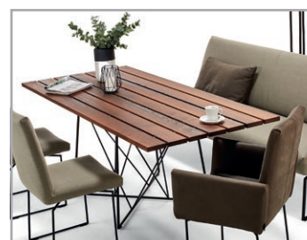
Dazu passend, gebretterter massivholz Esstisch